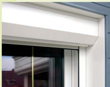
Coffre Monobloc RENOVATION à Pan coupé