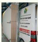
Essais quotidiens en sortie de profileuse, et essai de résistance au vent selon Normes en vigueur