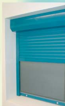
Moustiquaire intégrée en Option