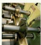
Profilage de la lame avec injection de la mousse polyuréthane