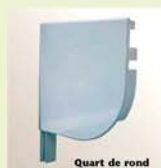
Quart de rond