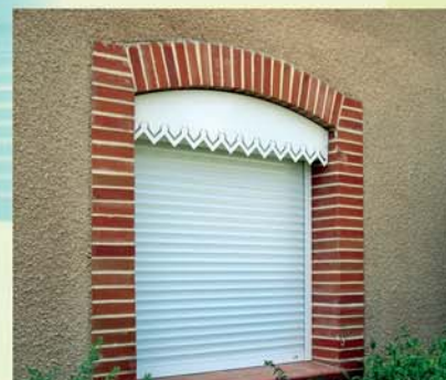
Lambrequin Aluminium avec 10 formes différentes en Option

Le coffre Monobloc Rénovation SODICOB est étudié pour s'adapter à toutes les menuiseries et ouvertures existantes. Sans dégâts supplémentaires, il se prête à la rénovation des habitations ou le volet roulant n'a pas été prévu. Il renforce la sécurité et permet d'obtenir un effet dissuasif face aux tentatives d'effraction.