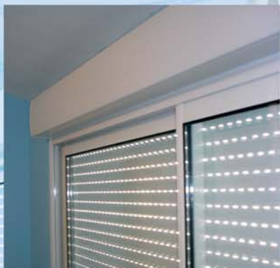
Le coffre de Bloc B existe en 3 dimensions pour s'ajuster au mieux à la taille du volet roulant et de la menuiserie.