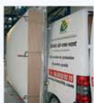
Essais quotidiens en sortie de profileuse, et essai de résistance au vent selon Normes en vigueur