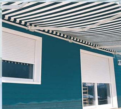
Vue de l'extérieur, le coffre disparaît derrière le linteau et devient invisible.