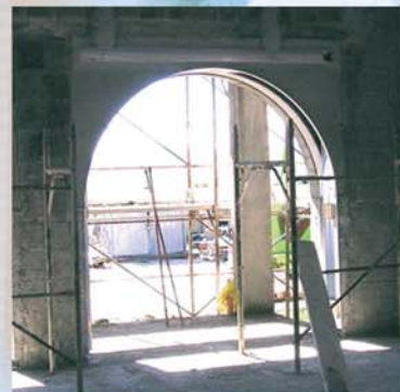
Coffre TUNNEL CINTRE en cours de scellement

Le coffre-tunnel SODICOB est une réponse technique et esthétique aux contraintes de la construction moderne. En effet, le coffre, pris dans la maçonnerie et le doublage d'isolation, devient complètement invisible après finition.