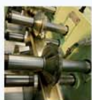
Profilage de la lame avec injection de la mousse polyuréthane