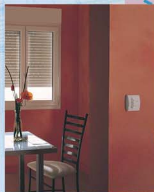
Doté des dernières technologies Radio, le Bloc B vous apportera "le confort à portée de main".

Le Bloc B PVC SODICOB une fois monté sur la menuiserie, constitue un ensemble homogène, doté de grandes performances thermiques et acoustiques .