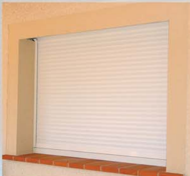
Volet roulant TRADITIONNEL dans coffre tunnel