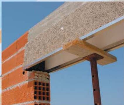
Coffre TUNNEL DROIT en cours de scellement