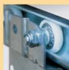
Au delà d'une certaine hauteur, nous équipons nos portes d'un palier mobile permettant le parfait déroulement du tablier et prolongeant ainsi sa durée d'utilisation.