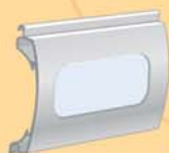
Nos portes peuvent être équipées de lames à hublots, pour laisser rentrer davantage de lumière dans votre garage. Autre option pour le cas d'un garage borgne par exemple, la lame aération permettant de ventiler en permanence le local.