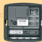
Récepteur Somfy AXROLL