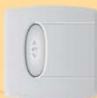
Poussoir intérieur RADIO