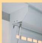
Débrayage manuel de votre porte par manivelle