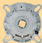
Système de pare-chute protégeant l'utilisateur d'un déroulement intempestif du tablier, en cas de défaillance du moteur